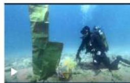
In fondo al mare il mistero della fortezza neolitica trovata al largo della costa croata