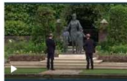
I 60 anni di Lady D, Harry e William di nuovo insieme per svelare la statua a lei dedicata