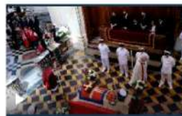
Savoia, il principe Duca Amedeo d'Aosta tumulato a Superga