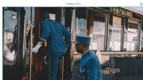
Venice Simplon-Orient-Express, A Belmond Train

Oltre ai viaggi di prossimità che con il Coronavirus vanno per la maggiore -Sardegna, Sicilia e Puglia in testa- per l'estate 2021 Vamonos-Vacanze.it propone anche suggestive mete a medio raggio come Mikonos e Formentera, applicando però un rigoroso protocollo Covid-19 perché la vacanza deve essere soprattutto una vacanza sicura. «Senza dimenticare le vacanze in barca a vela per le quali stiamo già registrando il tutto esaurito» puntualizza Lenoci.