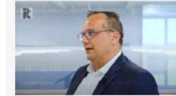
Pace (Exor International): "Maggiore efficacia ed efficienza: con Industria 4.0 entriamo in una nuova fase"